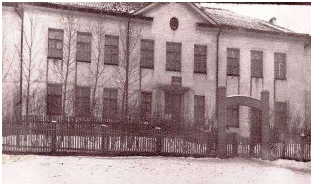
Владимирская средняя школа