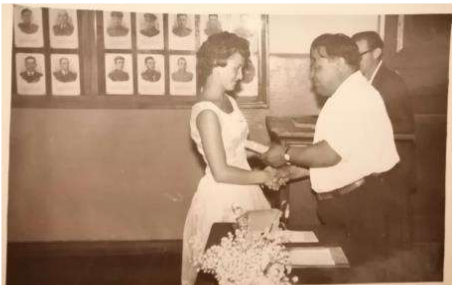
Традиционный вечер встречи выпускников в 1968 году.